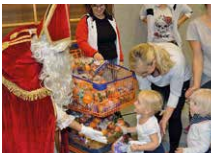
Das Beste vom Nikolausturnen ist wie immer das Päckle vom Nikolaus