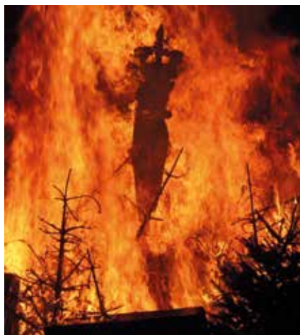
„Magisches Allgäu“

glaube und magischen Mächten“ und wird viel interessantes Wissen zu einer fast vergessenen Allgäuer Volkskultur vermitteln. Unter anderem geht es um Praktiken der „weißen und schwarzen Kunst“, Heiler, Suggestion und Telepathie. Im zweiten Teil dieses lebendigen Vortrags gibt Büchele einen Überblick über abergläubische und magische Vorstellungen im Jahres- und Lebensbrauch. Passend zur Jahreszeit wird er dabei insbesondere über das Brauchtum an Allerheiligen und Allerseelen berichten.