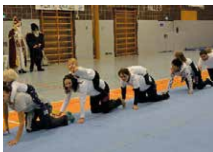
Bewegung soll Spaß machen! Die Kleinsten wissen, wie!

Die Stadtverwaltung prüft derzeit ein Carsharing-Angebot für das Stadtgebiet. In diesem Zusammenhang verweist die Stadt Sonthofen auf eine anonyme Online-Umfrage der Grünen Sonthofen zur Ermittlung des aktuellen Carsharing-Bedarfs, die bis Ende November läuft. Anhand von zehn kurzen Fragen wird ermittelt, was Einheimische und Urlauber in und um Sonthofen vom Carsharing erwarten und wie groß die Nachfrage sein könnte. Die Ergeb-