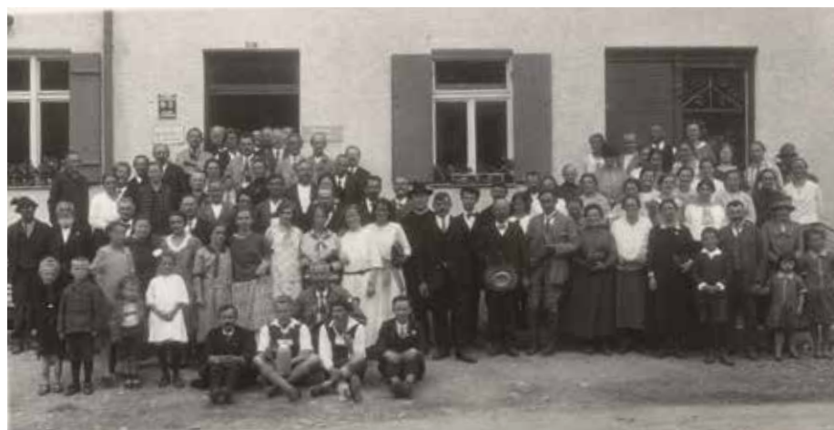
Das Gruppenfoto vom damaligen Kirchenchor entstand 1928 vor dem Entschener Hof in Walten.

Beginn ist um 10 Uhr mit einem Familiengottesdienst. Anschließend gibt es ein buntes Programm rund um die Kirche: An den Ständen und in der Cafeteria ist für das leibliche Wohl gesorgt. Am Brasilien-Stand gibt es Informationen zum Projekt „Licht für Coroatá“ - und natürlich Caipirinha. Für Jung und Alt gibt es ein Schubkarrenrennen. Zur Unterhaltung spielt die Riedener Blasmusik. Der Erlös des Pfarrfests kommt der Pfarrei St. Christoph und dem Projekt „Licht für Coroatá“ zugute.