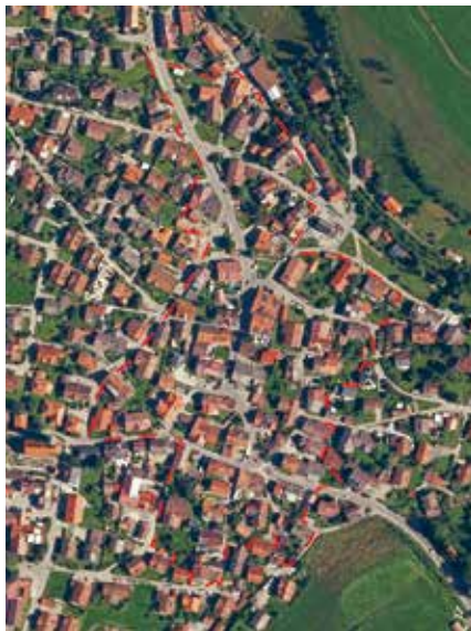
Neuer Umgriff des Bebauungsplanes Nr. 93 mit Erhaltungssatzung (in Aufstellung) sowie der Veränderungssperre