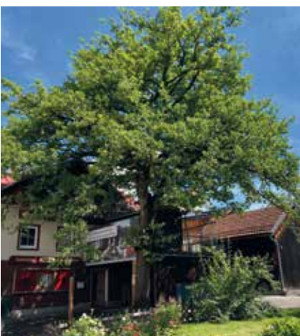
Als ein Beispiel für die prämierten Bäume – der Stadtbaum in der Fußgängerzone

Ein weiterer besonderer Baum steht in der Weststraße auf dem Grundstück der Familie Müller-Rapp. Die Eibe zeichnet sich durch ihr besonderes Alter aus und wird auf mehr als 300 Jahre geschätzt. Sie steht zusammen mit zwei weiteren sehr alten Bäumen und bereichert das Grundstück.