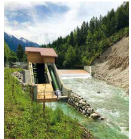
Das neue Konrad Zuse Wasserkraftwerk

Nach erfolgreichem Projektabschluss weihten die Allgäuer Kraftwerke am 24. Juni das neue Wasserkraftwerk Konrad Zuse in Hinterstein ein, und das genau