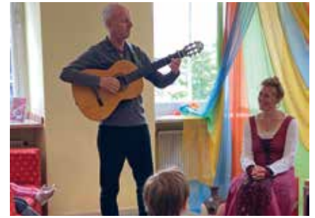
Für den Einstieg gab es musikalische Unterstützung aus der Musikschule