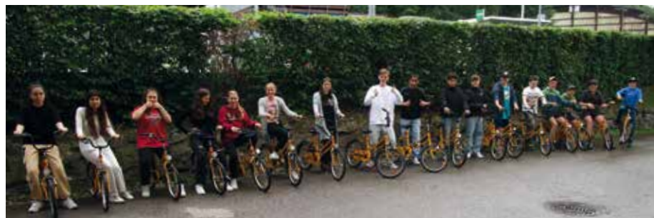
Die Aktiven der Fahrradwerkstatt AG beim Abholen der Räder

Die Jugendverkehrsschule hat ihren Standort nun schon seit einigen Jahren im Sontra Technologie- und Dienstleistungszentrum. Auf der weitläufigen Fläche im Untergeschoss lernen die Schülerinnen und Schüler der vierten Grundschulklassen das sichere Verhalten im Straßenverkehr. Ausgebildet werden in jedem Jahr um die 300 bis 350 Viertklässler. Nachdem in den letzten Jahren schon in die Ausstattung der Jugendverkehrsschule investiert wurde und eine neue Ampelanlage und neue