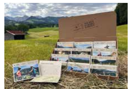
Kartenständer mit Tourensammelkarten

Die topografische Wanderkarte im Maßstab 1:35.000 gibt es ab August für 5,50 Euro in den Tourist-Infos zu kaufen. Mit einem Teil der Einnahmen unterstützt Alpsee-Grünten Tourismus weiterhin die Bergrettung, denn 50 Cent pro verkaufter Wanderkarte gehen als Spende an die Bergwacht Immenstadt und Sonthofen.