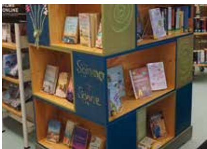
Das „Nachhaltigkeits-Regal“ im Erdgeschoss bietet viele Anregungen zum Thema

Außerdem „lebt“ die Stadtbücherei die Idee der Nachhaltigkeit. So konnten in der Vergangenheit immer wieder Upcycling-Projekte umgesetzt werden: vom jährlichen Bücher-Christbaum über Bücherskulpturen bis hin zum Umbau der Empfangstheke im Erdgeschoss. Dieser wurde von den äußerst kreativen Stadt-Schreibern ausschließlich mit vorhandenem Material umgesetzt. Als Kultur- und Bildungseinrichtung, in der Information, Wissen und digitale Infrastruktur langfristig, niederschwellig und konsumfrei für alle BürgerInnen zur Verfügung gestellt und geteilt werden, leistet die Stadtbücherei somit einen wesentlichen Beitrag zu einer nachhaltigen Entwicklung der Gesellschaft.