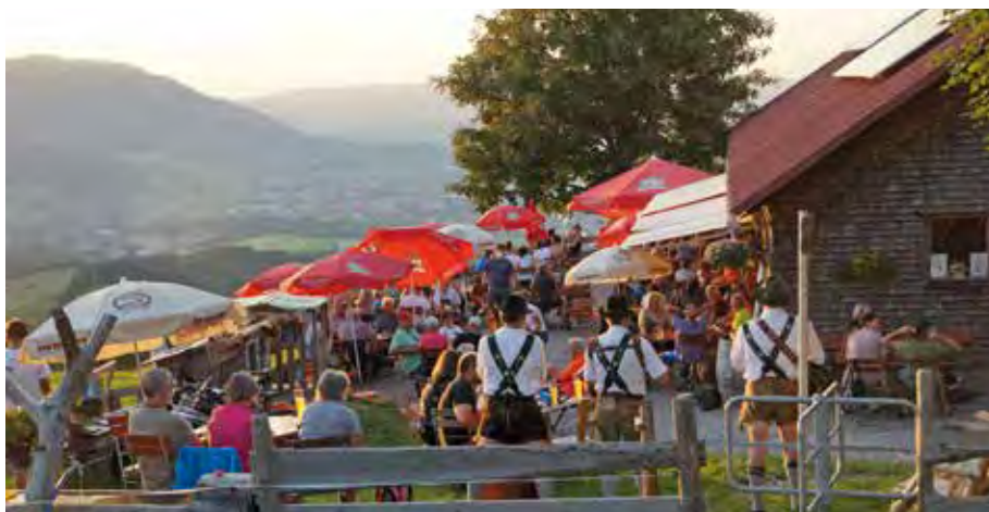
Auch diesen Sommer gibt es ein Konzert auf dem Sonthofer Hof