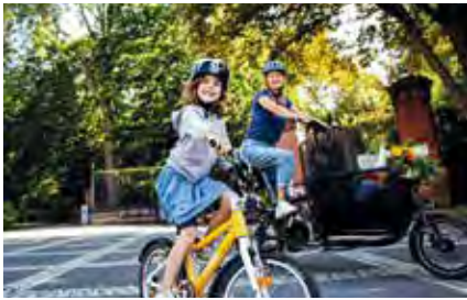
Stadtradeln 2022