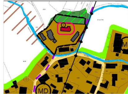
4. Änderung des Flächennutzungsplanes, Maßstab 1:5.000