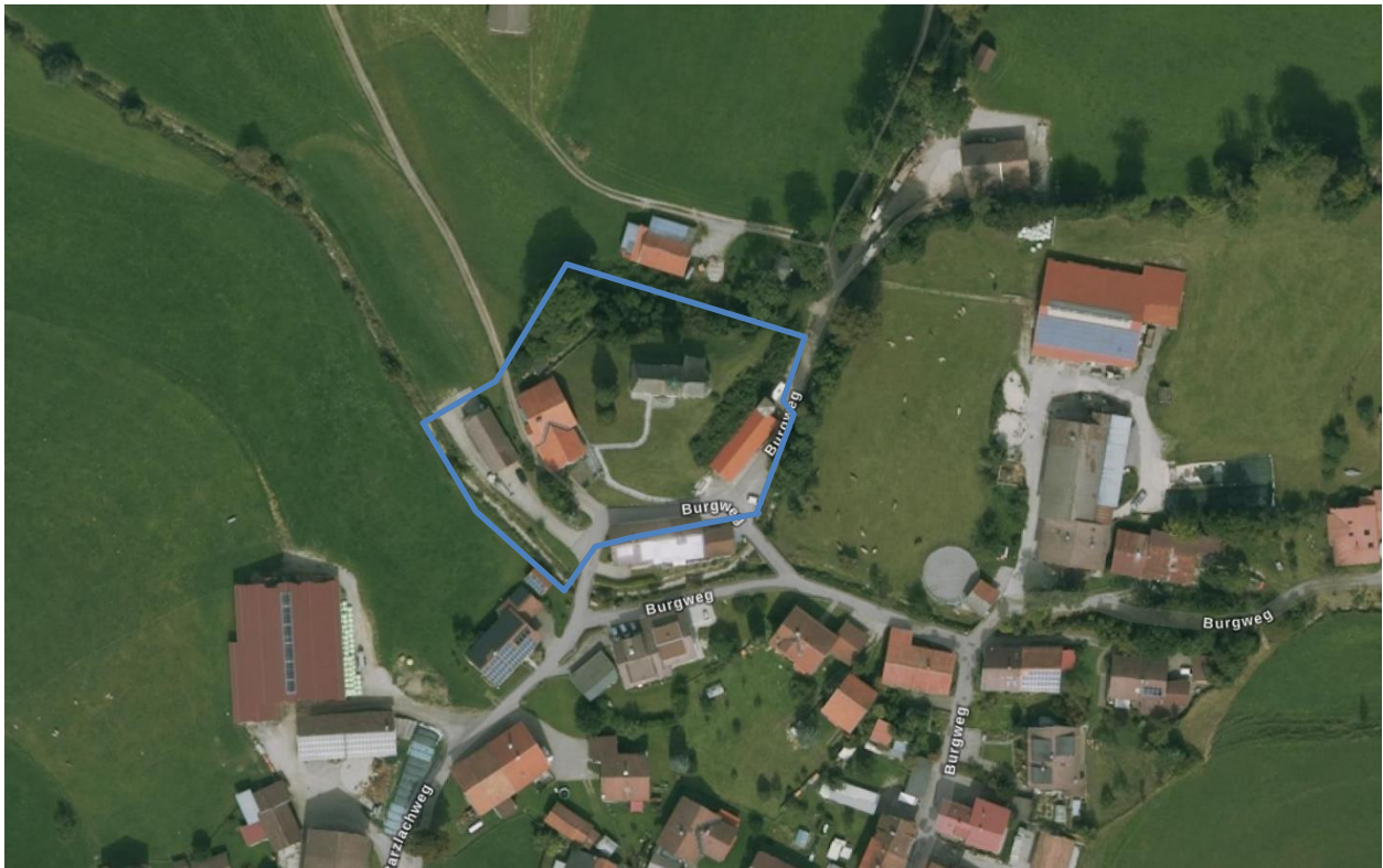
Abbildung 1: Topographische Karte vom Plangebiet und der Umgebung, o. M.

Die zu beplanenden und zur Nutzung für regenerative Energiegewinnung vorgesehenen Flächen sowie die vorgesehene Ausgleichsfläche befinden sich im Gebiet der Stadt Sonthofen im Ortsteil Berghofen. Der Geltungsbereich der Flächennutzungsplanänderung umfasst eine Fläche von rund 5.000 m 2 (0,5 ha) und beinhaltet vollständig die Flurnummern 1932, 1933, 1934, 1936 sowie Teilflächen der Fl.-Nrn. 1937, 2316/2, 2321.