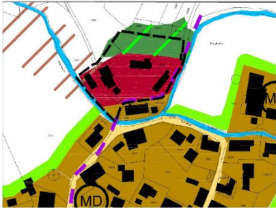
wirksamer Flächennutzungsplan, Maßstab 1:5.000