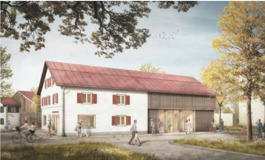
Geplanter Haupteingang auf der Nordseite des Museums © Architekturbüro Andreas Ferstl

gerechter, dass Sonthofen erst seit sehr kurzer Zeit eine Stadt ist.