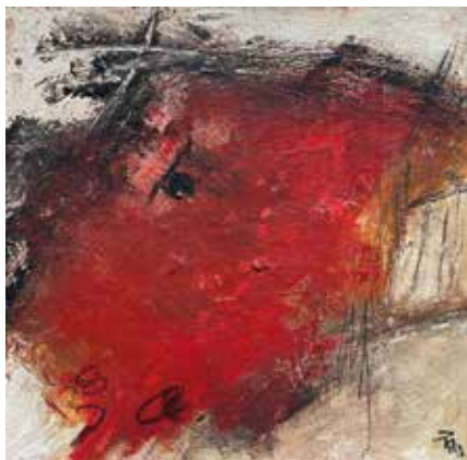
Ohne Titel © Petra Klos 2020

Seit 2020 macht sich die Stadthausgalerie Sonthofen mit Ausstellungen angesehener lokaler und internationaler Künstler einen Namen. Ein besonderes Anliegen ist dabei die Förderung der regionalen Kunstszene. Neben der großen Sammelausstellung „BLICK:PUNKT Allgäu“ wird auch Einzelkünstler/innen die Option einer umfassenderen Einzelausstellung geboten. Aus den zahlreichen Bewerbungen für das Jahr 2021 hat eine fachkundige Jury drei Künstler/innen ausgewählt, die in einer dreifach Einzelausstellung ihre Werke in der Stadthausgalerie zeigen sollten. Coronabedingt musste leider das deutsch-argentinische Künstlerpaar seine Teilnahme absagen, sodass daraus letztendlich eine zweifach Einzelausstellung wurde. Zu sehen sind mit der Ausstellung „Raum in Raum“ vom 18. Dezember 2021 bis einschließlich 9. Januar 2022 Werke von Petra Klos und Jan Langer.