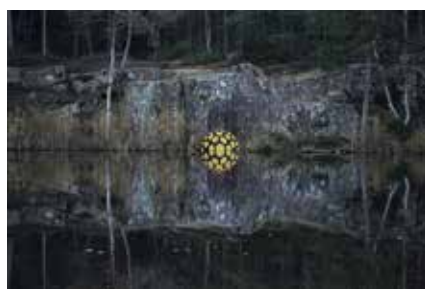
SPIEGELUNG I © Jan Langer 2020

Bei Redaktionsschluss galten folgende Beschränkungen: Der Zutritt zur Galerie ist nur mit einem 2G-Nachweis (geimpft oder genesen) erlaubt. Darüber hinaus muss beim Besuch eine FFP2-Maske getragen werden. Zu beachten sind außerdem die üblichen Hygiene- und Abstandsregeln. Die Registrierung erfolgt über die Luca-App bzw. in Papierform. Weitere Informationen zum aktuellen Stand unter www.stadthausgalerie.de .