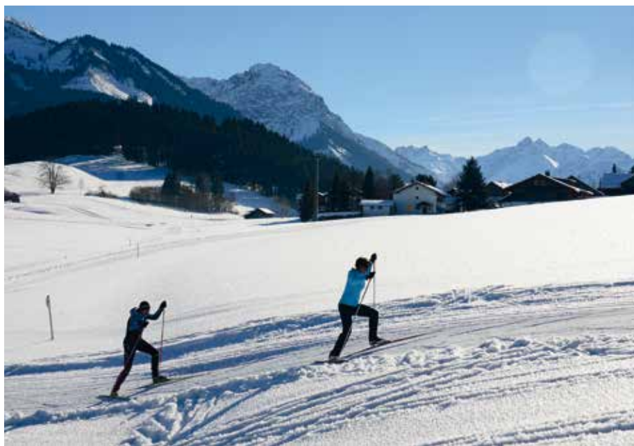
Archivbild 2017: Loipe in Beilenberg