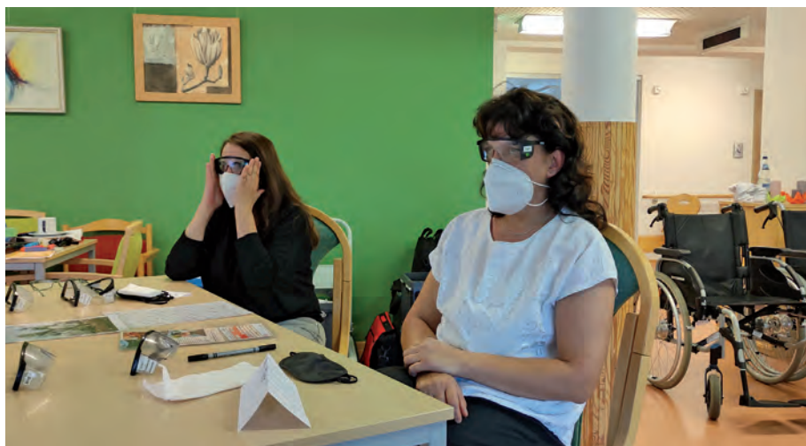
AllgäuPflege, Mitarbeiterinnen der Tagespflege testen mit Simulationsbrillen, wie sich die Sehbeeinträchtigung auswirkt