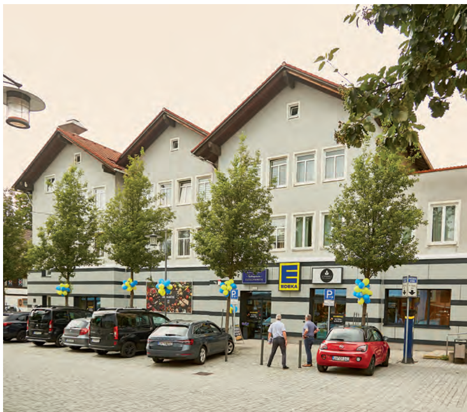
Der neue EDEKA-Markt in der Hirschstraße nach dem Umbau

Die 16 Städte werden nun mit fachlicher Unterstützung unter anderem durch Landschaftsarchitekten und Stadtplaner ihre Bewerbungskonzepte erarbeiten. Ebenfalls erforderlich ist es, bereits in einem frühen Stadium Bürger und Bürgerinnen, regionale Verbände sowie Vertreter aus Wirtschaft, Umwelt und Kultur in die Planungen einzubinden. Abgabeschluss der offiziellen Bewerbungsunterlagen für das Zuschlagsverfahren ist der 8. April 2022.