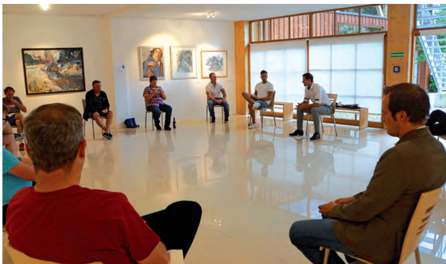
Der vorerst letzte #SonthoferDialog fand mit den Vertretern der Sportvereine statt

So entwickelte er das Format #SonthoferDialog in Form von Gesprächsrunden mit Vertretern aus Handel/Sontra, Hotellerie/Gastro, Sportvereinen, Kulturschaffenden und den Sozialvereinen. Angedacht war auch ein Austausch mit dem Jugendparlament, welcher leider durch die Nähe zu den Sommerferien auf wenig