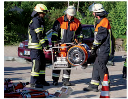
Übungseinsatz der Feuerwehr Sonthofen

Im Herbst wird die Feuerwehr Sonthofen einen weiteren Lehrgang für Quereinsteiger anbieten und sucht hierfür neue Teammitglieder. Sollte die Corona Pandemie wieder zuschlagen, kann die Ausbildung auch wieder zum Großteil online stattfinden, andernfalls trifft man sich gemeinsam am Feuerwehrhaus Sonthofen.