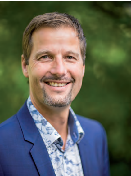
1. Bürgermeister Christian Wilhelm