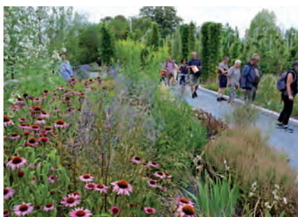
Archivbild von der Landesgartenschau in Würzburg

Schwaben: Günzburg, Memmingen, Sonthofen, Wemding