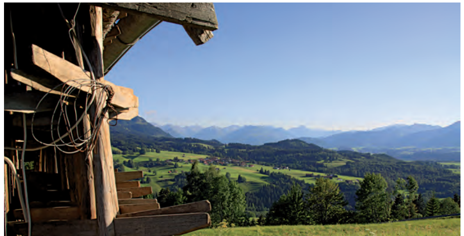
Schöner Ausblick zwischen Unterried und Tiefenbach

Die Stadt Sonthofen stellte sich auf der siebten Bayerischen Fachtagung Radverkehr als kommunales Praxisbeispiel einem breiten Fachpublikum vor. Auf Landkreisebene stellte sich der Landkreis Augsburg vor. Fachexperten und das Staatsministerium für Wohnen, Bau