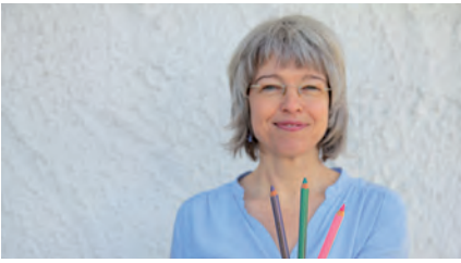
Kommunikationstrainerin Urs Weiß