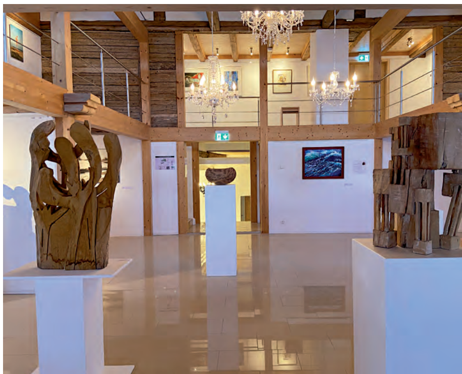
„Hommage an das Allgäu“ – Werke der städtischen Kunstsammlung im Dialog miteinander