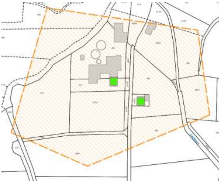
Karte 3: Los 2: Auf der Gerbe 1 und 4