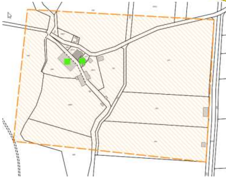
Karte 4: Los 2: Zur Mühle 9 und 11