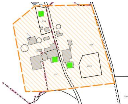
Karte 5: Los 2: Bommerstallstraße 12, 13, 14