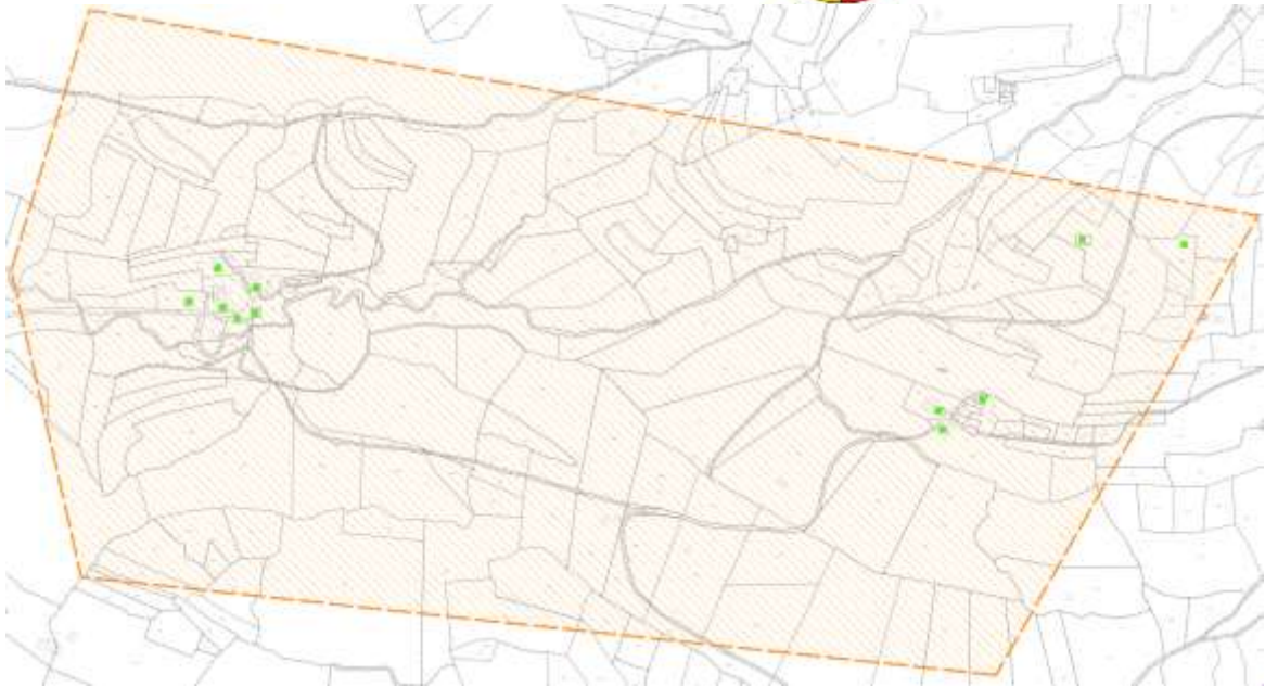
Karte 6: Los 3: Unterried, Breiten