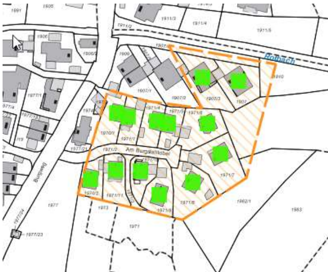
Karte 7: Los 3: Am Burgstalltobel;

Achtung: hier werden 30 Mbit/s flächendeckend und 50 Mbit/s für einzelne Endkunden als ausreichend angesehen!