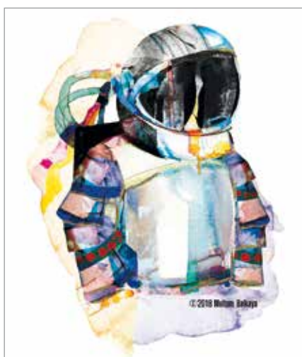
Zeichnung „Supergute Tage“: Meltem Balkaya

muss sie nur sehen. So wurde versucht, solch einmalige Momente mit der Kamera festzuhalten. Diese digitale Multimedia-show setzt sich aus Sequenzen der Berge, des Waldes, des Sees, des Flusses, der Wiese, des Moores, der Auen, der Steppe, der Küste und des Himmels zusammen. Dazu unterstreichen viele bekannte Oldies die Präsentation und geben den Bildern ein ganz besonderes Flair. Kommen Sie, staunen Sie und lassen Sie sich für eine Zeitlang in eine wundervolle Zauberwelt entführen. Ohne gesprochenen Kommentar, aber die meisten Bilder haben einen kleinen erklärenden Text. Der Eintritt beträgt 8 Euro. Weitere Informationen im Heimathaus Sonthofen, Sonnenstraße 1, 87527 Sonthofen, Tel.: 08321/3300 zu den Öffnungszeiten Di – Do, Sa, So 15.00 – 18.00 Uhr.