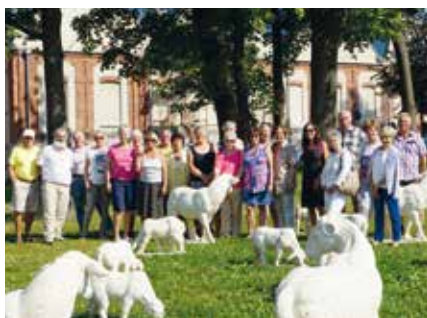
Die ehrenamtlichen Helfer vor dem Textil- und Industriemuseum in Augsburg.

bis zum 30.09. unter Angabe Ihrer Kontaktdaten mit, wann, wo und was Sie am 16. November in unserer Stadt vorlesen möchten. Jeder kann mitmachen. Anmeldungen nimmt der Fachbereich Kultur der Stadt Sonthofen unter kultur@sonthofen.de gerne entgegen.