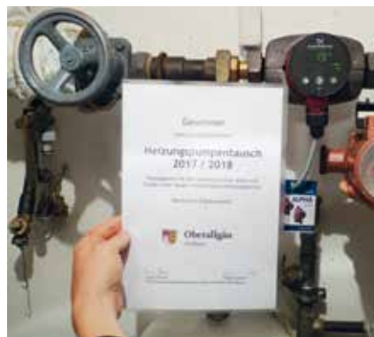
Der Einbau ist erfolgt: zwischen dem alten und dem neuen Pumpen-Modell liegen rund 40 Jahre

Im vergangenen Winter wurde sie gesucht, die „älteste Heizungspumpe im Oberallgäu“ Mit dieser Aktion machte die Koordinationsstelle Klimaschutz auf den hohen Energieverbrauch veralteter Pumpen aufmerksam und rief die Bürger dazu auf, sich mit einem Foto ihrer Heizungspumpe um den Titel zu bewerben. Zu gewinnen gab es eine moderne Hocheffizienzpumpe, gesponsert von der Firma Grundfos, inklusive Einbau.