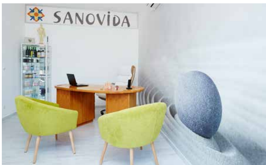
Die neuen und einladenden Praxisräume