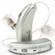
Symbolfoto Hinter-dem-Ohr Hörsystem

Jetzt 4 Wochen besseres Hören leihen & Weihnachtbuch abholen!