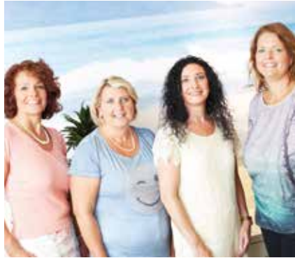
Das Beratungsteam der TUI in Sonthofen

Manch ein Passant hat sich bereits über das „neue“ Reisebüro in der Bahnhofstraße 24 in Sonthofen gewundert. Doch die gute Nachricht ist, dass es mit gleichem Team bei gleicher Qualität wie gewohnt für die Sonthofer Kundschaft weitergeht.